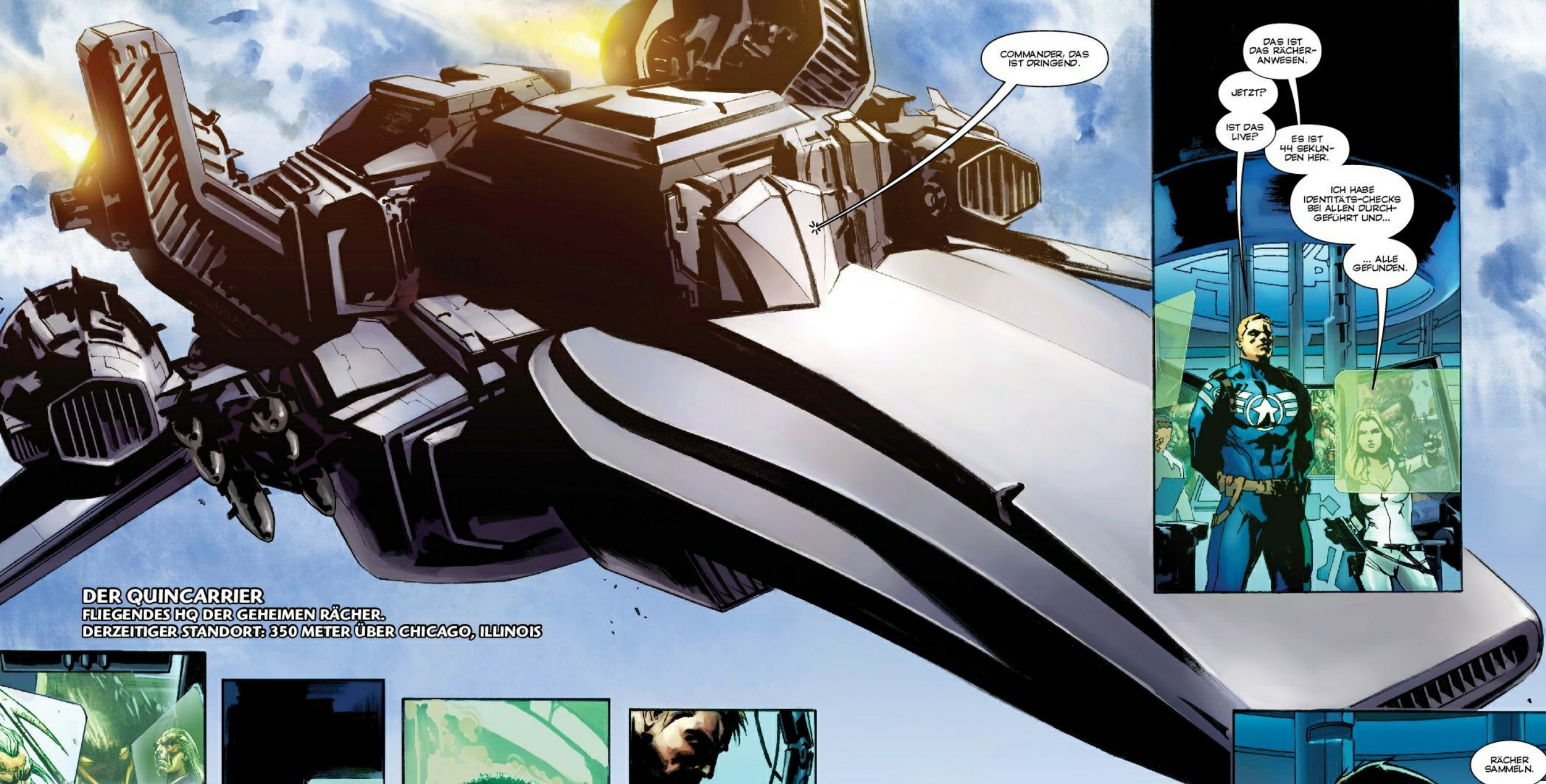
DER QUINCARRIER FLIEGENDES HQ DER GEHEIMEN RÄCHER. DERZEITIGER STANDORT: 350 METER ÜBER CHICAGO, ILLINOIS